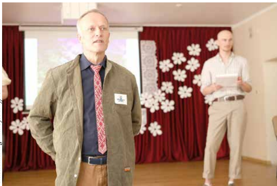
Nuotrauka iš gimnazijos arvyvo

Užpaliuose, manau junta tą gerą aurą, kurią kuria žmonių darbštumas, išsilavinimo ir mokslo siekis. Visa tai tikriausiai pareina nuo bajorų ir čia gyvenusių